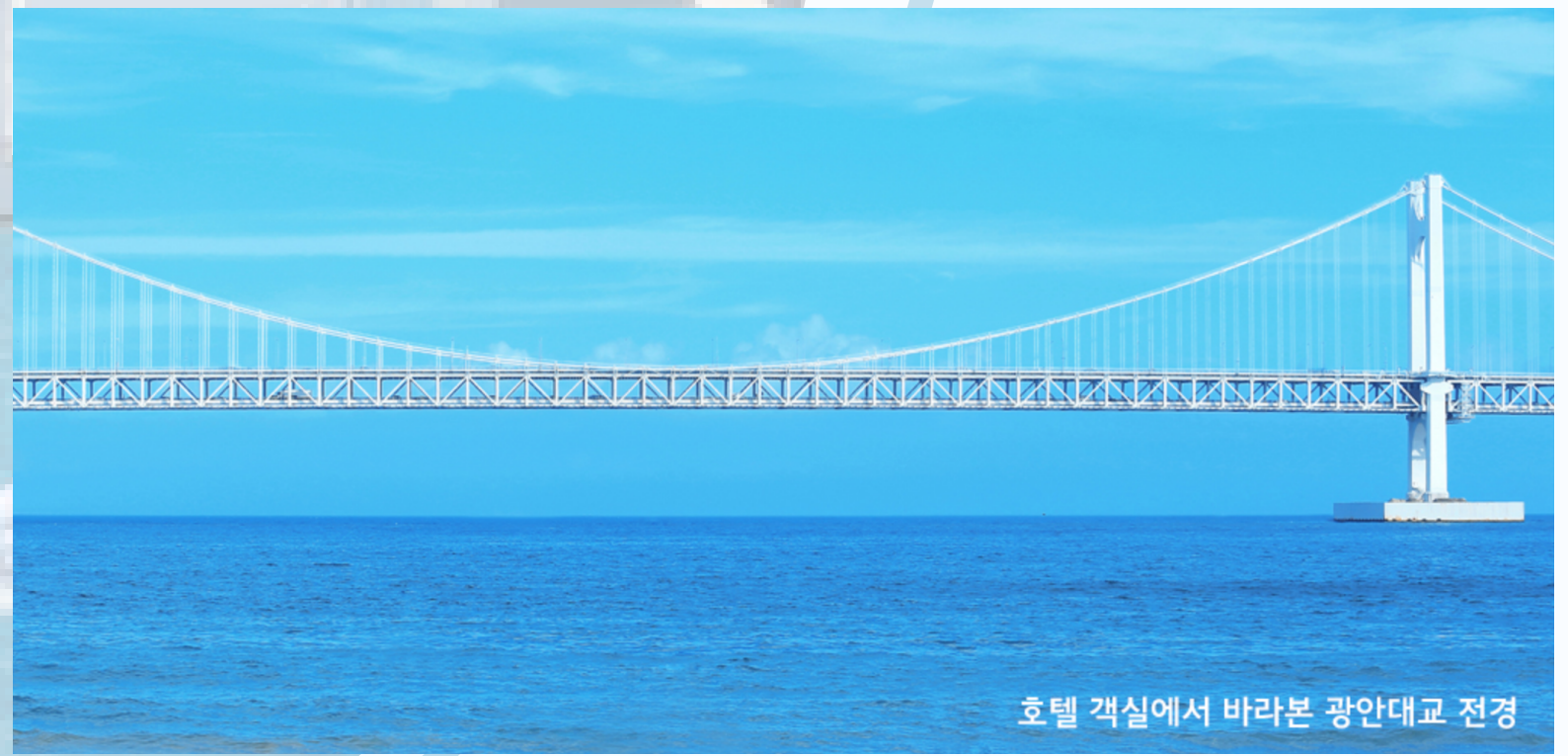
호텔 객실에서 바라본 광안대교 전경